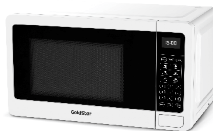
IMÁGENES A MODO ILUSTRATIVO